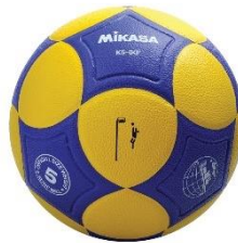
Figura 7 – Bola oficial de corfebol