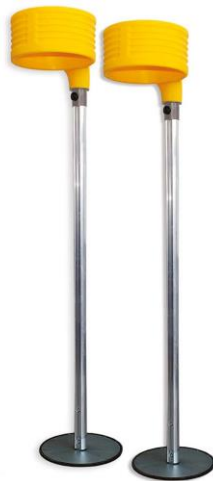
Figura 6 – Altura da rede de peteca

✓ A cesta de corfebol deve ser instalada numa altura de 3,5 metros do solo e apresentar um diâmetro superior (abertura) de 39 a 41 cm.