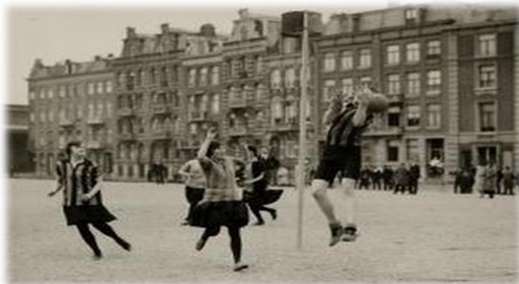
Figura 3 – Representação de uma partida de corfebol no início do século XX

Aos poucos, o número de praticantes foi aumentando, principalmente entre crianças e jovens que tinham no esporte uma referência de integração e cooperação. Ao longo dos anos o Corfebol foi conquistando as pessoas, tanto que hoje, o Corfebol tem atualmente cerca de 200 mil praticantes na em todo o mundo, segundo dados da confederação holandesa de Corfebol. O Corfebol levou um certo tempo para se expandir em suas fronteiras, e só em 1920, o esporte foi apresentado como modalidade de demonstração nos Jogos Olímpicos de Antuérpia, na Bélgica. Neste mesmo ano, a Bélgica que devido à proximidade geográfica com a Holanda, desenvolveu a modalidade, e, em 1921, criou a Associação Nacional Belga. Hoje as duas equipes nacionais praticamente comandam o mundo do Corfebol, que por serem as primeiras à praticarem, acabaram se tornando os países que detém o maior número de títulos dos campeonatos mundiais disputados até os dias de hoje.