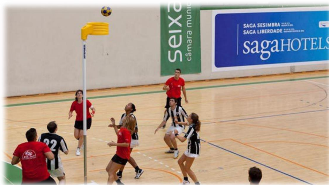
Figura 1 – Representação de uma partida de corfebol

O jogo consiste em encestar a bola no cesto da equipe adversária para marcar pontos e, simultaneamente, evitar que a equipe adversária enceste no seu cesto, respeitando todas as regras do jogo. A equipe que tiver mais pontos no fim do tempo regulamentar será declarada vencedora.