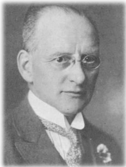
Figura 2 – Nico Broekhuvesen

A modalidade surgiu na Holanda em 1902 e foi inventada pelo professor, Nico Broekhuvesen. O holandês inspirou-se num jogo chamado Ringball, que conheceu na Suécia durante um curso de verão. Depois de alguns ajustes, Nico adaptou a modalidade e designou-a como Corfebol, que em Português significa "bola ao cesto". Naquela altura, a Associação de Educação Física de Amsterdã procurava um jogo que pudesse ser praticado por crianças, jovens e adultos de ambos os sexos, com o objetivo de mantê-los sadiamente ocupados, já que no início do século não era comum mulheres praticarem esporte. Seja um esporte ou simplesmente uma recreação, o Corfebol conseguiu revolucionar sua época, início do Século XX, um cunho social relevante ao colocar a mulher nas mesmas condições que o homem. O professor Nico começou a introduzir a modalidade nas escolas primárias holandesas, com o intuito de manter as crianças ocupadas e afastadas de problemas que se referem à delinquência juvenil. Visto que naquela época, a Holanda ainda vivia os efeitos da Revolução Industrial, que obrigava os pais dos alunos a trabalharem geralmente 12 horas por dia. Com isso, as crianças ficavam grande parte do tempo sozinhas.